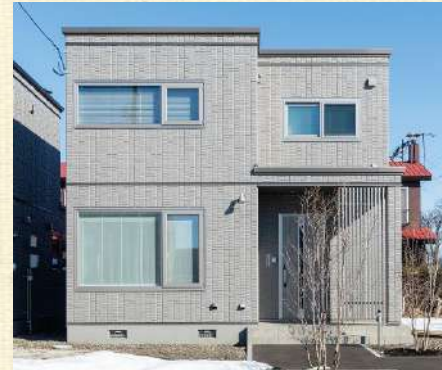
写真はすべて2024.3撮影