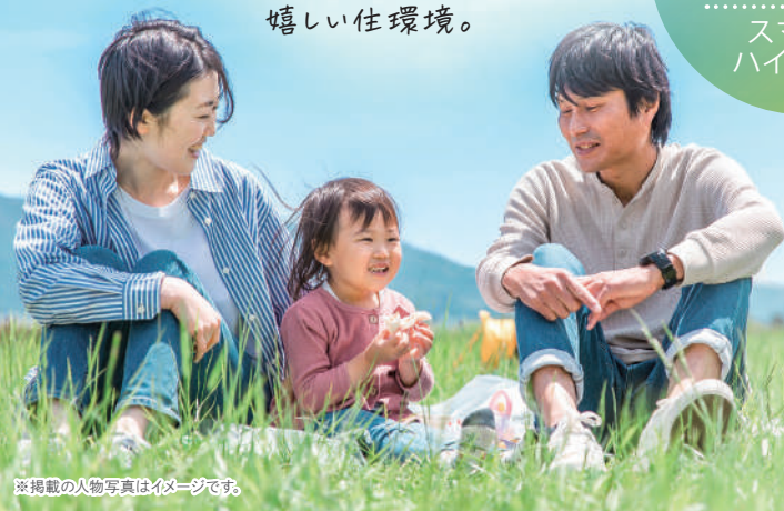
※掲載の人物写真はイメージです。