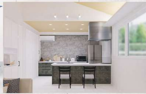
※内観はパースです。